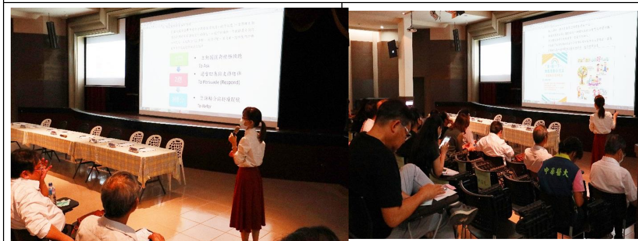
學輔中心主任報告校園安全相關措施與輔導工作重點，加強學校自我傷害預防工作