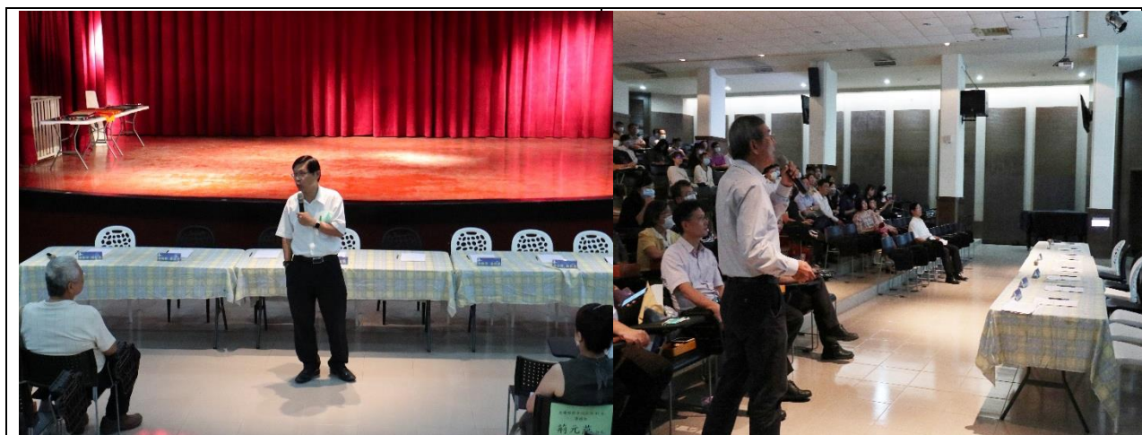
校長及學務長說明校園安全近況並呼籲教職員多加關注學生狀況