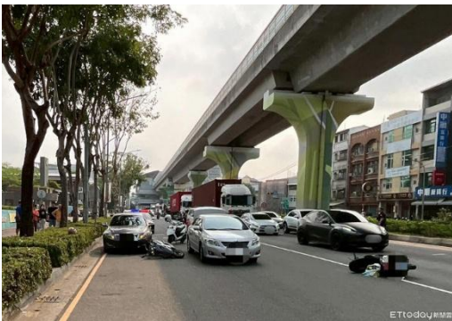
▲一輛自小客車從路邊起步時與機車發生碰撞，車內乘客下車察看，導致另一部機車被車門擊落。

警方獲報到場處理，對所有當事人進行酒測，數值均為零。初步研判，除了首段起步碰撞責任外，針對乘客開門釀災的部分，將依據《道路交通管理處罰條例》第56-1條規定，對汽車駕駛人處以2400元以上、4800元以下罰鍰。