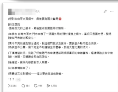
民眾於台灣大哥大購買漫遊卡卻涉及詐欺案。

一名內行就指出，首先預付卡有半年效期，等同於申請當下有半年時效，只要半年未予充值，門號就會直接失效釋出，不過門號「可以重複回收再利用」，當詐騙集團行騙後，警方因流程問題，只能找當下門號使用者處理，形容就像交通違規罰單寄錯人，民眾只能自行申訴，摸摸鼻子自行跑流程。內行認為，這是台灣法規制定的漏洞，讓詐騙集團趁門號重複回收再利用的優勢行騙；不過一派認為，電信業者也應盡責，避免後者遭受牽連、承擔後續影響；對此，民眾建議，申辦門號應多留意、留存申辦資料，因為「一個門號背後可能不只是你想的那麼單純」，相當無奈。