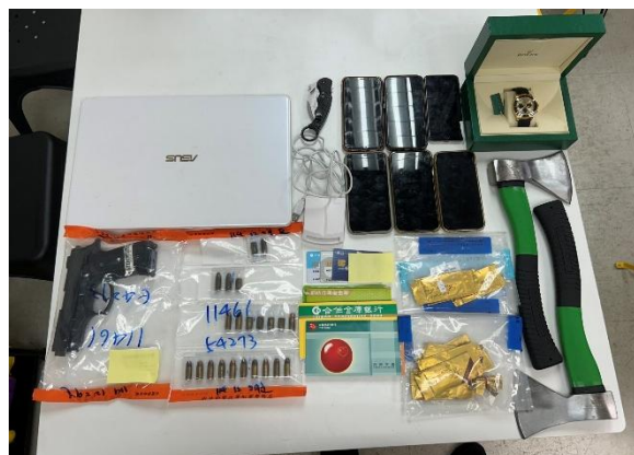
▲專案小組兵分多路至新北市五股區、高雄市左營區等幫派據點執行搜索，查扣相關贓證物。