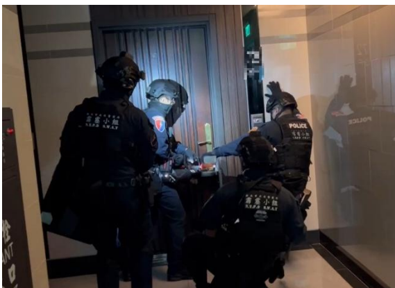
▲刑事警察局偵查第七大隊宣布成功破獲國內首宗「eATM 試卡」詐騙集團。

刑事局呼籲，警方將持續貫徹「掃黑、肅槍、緝毒」政策，嚴正打擊幫派暴力與不法行為，絕不容許黑道勢力吸收少年，以確保國民生命財產安全，並營造安心、優質的投資與生活環境。