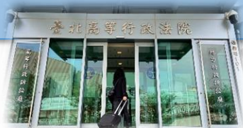
北高行批評男方以交往為由，無視女方意願。

至於男大生認為兩人互動親暱，北高行則批評，男、女朋友之間就算可以在一定範圍內親密互動、碰觸私密部位或從事性行為，但也應該尊重對方的自我決定權，不能僅因為兩人交往，就排除對方的性自主權，否則無異於讓伴侶成為「奴隸或洩慾工具」，也違背性騷擾相關法律的規範目的。女方拒絕與男大生發生性關係，也多次反對男大生對她做出帶有性意味的舉動，男大生如果不能接受女方的反應，也應該彼此溝通，不該拿安慰或促進感情當理由，無視女方的意願，因此判男大生敗訴。本案可上訴。