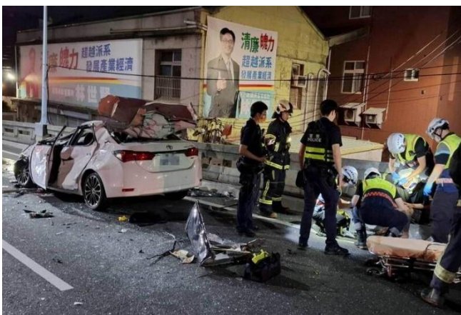
▲被撞的轎車女駕駛，被救出送醫仍傷重不治。

肇事的BMW在撞擊機車騎士後繼續開往中華陸橋，又撞擊1輛由24歲女子駕駛搭載新婚夫的轎車，造成轎車幾乎被撞成廢鐵，BMW也當場翻覆，BMW駕駛僅受輕傷；轎車女駕駛與新婚夫則一度受困車內，消防局派員趕往現場動用破壞器材將2人救出，但女駕駛呈現OHCA（到院前無呼吸心跳），經急救後往彰化基督教醫院搶救，仍因傷重宣告不治，僅受輕傷的新婚夫悲痛萬分。